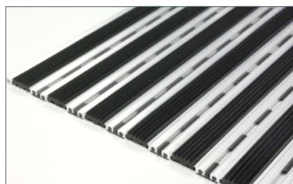
FELPUDOS DE ALUMINIO CON CAUCHO