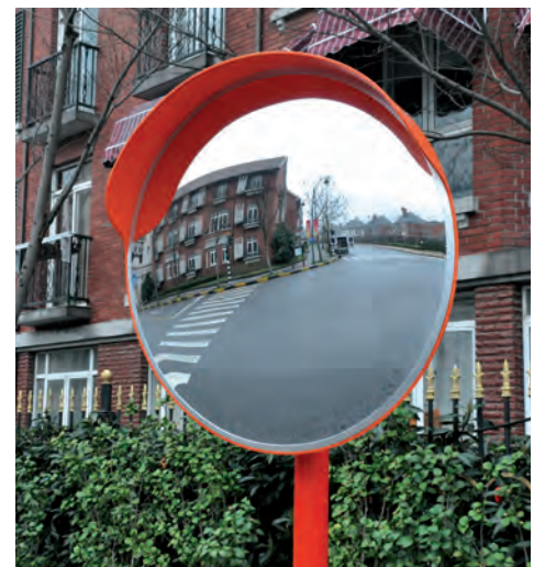
MIR003. Espejo convexo acrílico y armazón de polipropileno color naranja, con visera protectora.