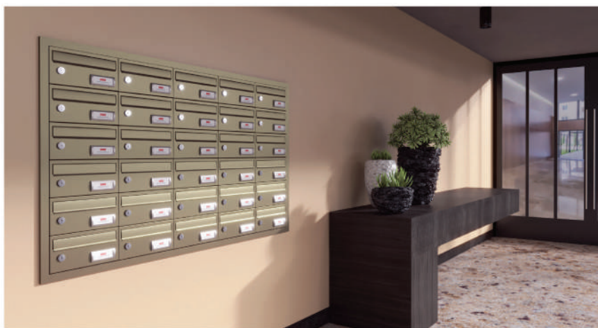
Instalación acabado efecto CHAMPAGNE